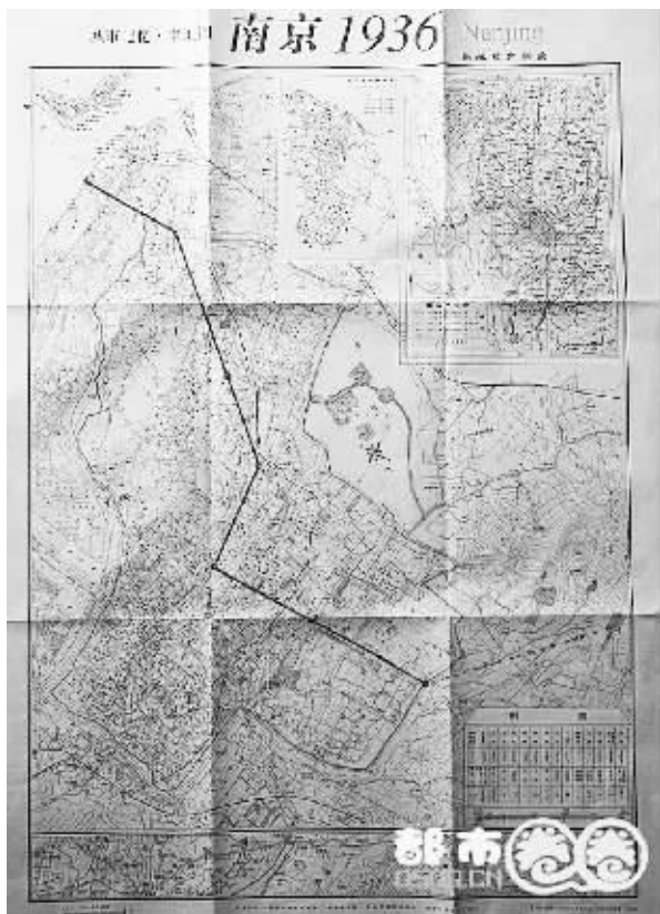
高松在地图上标出白天经过的七个点,再将各点连成一线,就有了他的这个发现。