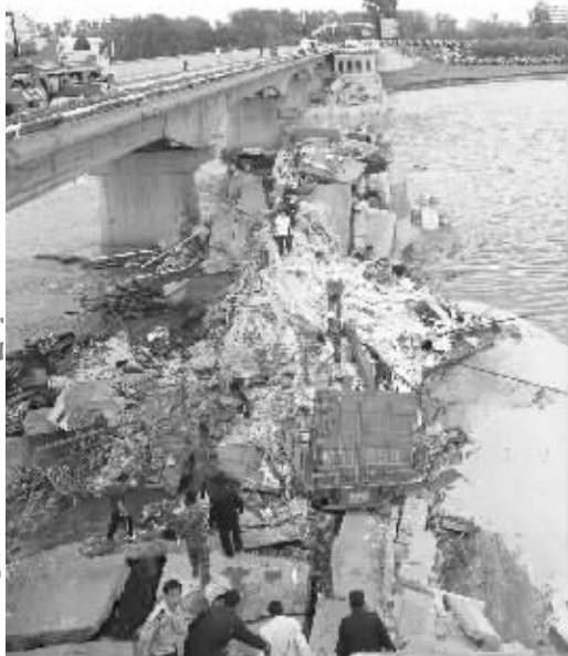
垮塌的大桥现场(6月29日摄)

29日凌晨2时30分许,黑龙江省铁力市呼兰河大桥发生垮塌事故。记者从铁力市政府了解到,事故现场有落水车辆8辆,其中货车7辆、微型面包车1辆;落水人员18人,其中4人受伤无生命危险,4人死亡,其他人无碍。事故发生后,铁力市消防、公安、武警、交通、医疗等400余人参与救援,目前仍在打捞落水车辆。