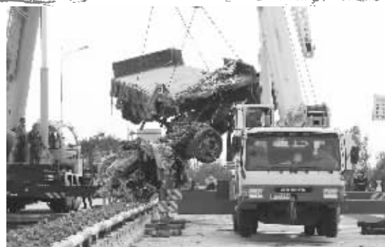
吊起坠河车辆残骸