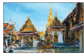
合作,继续开通直飞曼谷/普吉等地的包机,将更多精彩缤纷的品质泰国游产品介绍给每位游客。

有着丰富的旅游资源和独特的风土人情,是性价比很高,安全友好的旅游目的地。南京中北还将继续发挥中北泰国操作泰国游的优势,陆续推出曼谷高尔夫自由行、清迈寻秘之旅、华欣SPA之旅、苏梅岛蜜月之旅等特色中高端产品,同时,南京中北还将继续加大与各大航空公司