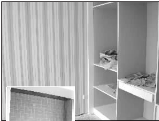
网友 DJ7 的家

网友 DJ7 现如今成了博客里的大红人,他的每篇博客日志几乎都受到圈友们的热力追捧。他在自己的博客里向网友公布了自己小家装潢的每一个过程,也有自己装潢的心得,引起了许多也在装潢的网友的共鸣,大家在博客里纷纷讨论,墙纸该用什么颜色,书柜应该怎么打,DJ7 俨然成了“装潢达