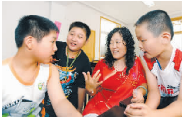
在妈妈们的带动下,孩子们开始熟络起来

上周六,快报“欢乐社区行”走进树德里社区,跟居委会的“社区妈妈关爱团”一起,将社区的25名小朋友聚集到一起,举办了一场别开生面的“新朋友见面会”,让大家彼此认识,结成暑假好玩伴。这下,这些孩子不用“宅”了。快报记者 钟晓敏 王凡 赵丹丹 沈晓伟