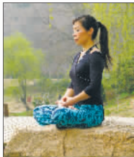
水,身心一致,她的境界与年龄一致,如同钻石,历久弥珍。