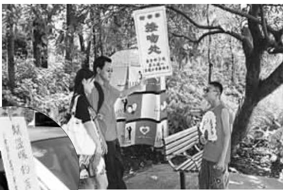
▲7月8日,13岁男孩在公园内设接吻处 ▲6月1日,男孩坐在宝马车上“钓”后妈

明眼人都能看出,两次网络事件中的男孩肯定有幕后推手。7月13日,当事人通过报社首次回应了事件出炉内幕。