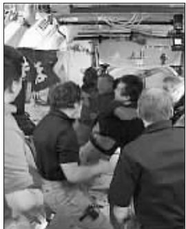
这张7月17日美国航天局的视频截图显示了在美国“奋进”号航天飞机与国际空间站成功对接后，空间站内的宇航员欢迎“奋进”号的宇航员