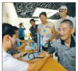
454医院医生为居民量血压

上周六,454医院派出3位主治医生“助阵”快报欢乐社区行。听说参与活动不仅可以测量血压,还能获得600元免费体检卡,上百位市民赶来排队。