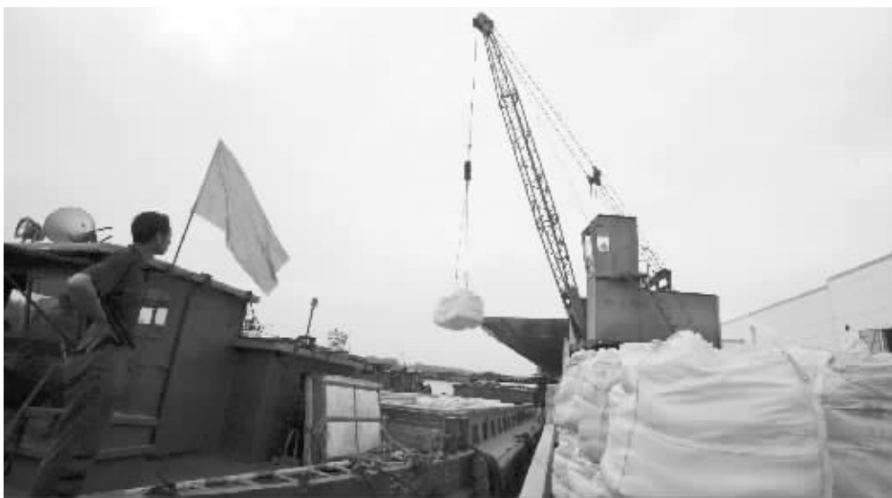
运河边上的运盐码头,至今依然忙碌