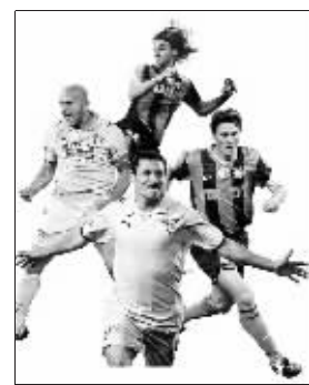
巨星云集,这回球迷有眼福了

于该赛事不同于商业比赛,冠军将被载入意大利足球俱乐部荣誉史册,双方必定会尽遣主力出战,而中国球迷也可以近距离观赏到豪门之间的巅峰对决。值得一提的是,国际米兰是国际足坛的豪门俱乐部,拥有意甲联赛冠军奖杯17个,拉齐奥同样实力不俗,意甲联赛2次夺冠。国际米兰和拉齐奥谁能捧得史上最有纪念意义的超级杯,球迷将拭目以待。宗和