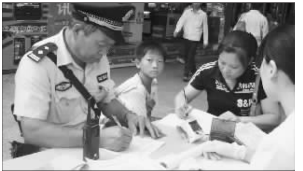
老警察填写献血表时的照片