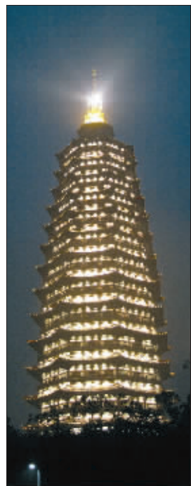
② 食甚时分,天宁宝塔附近白天变黑夜