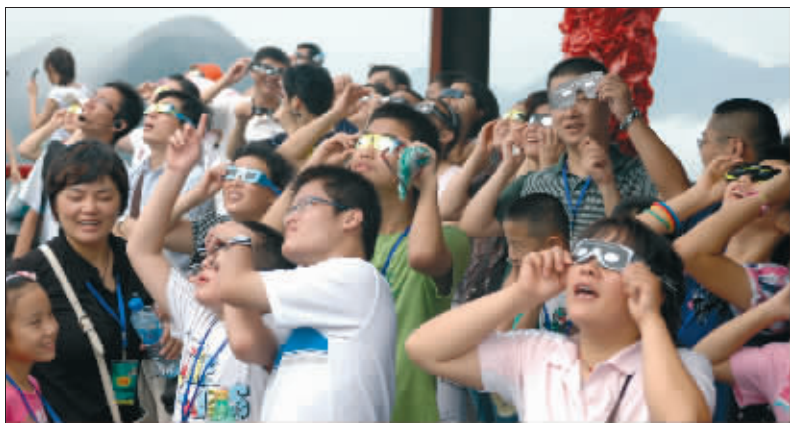
天文爱好者在吴越第一峰上纷纷戴上观测镜看日食