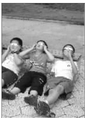
孩子们躺地上看日全食

昨天早晨,天气没有挡住热情的天文爱好者的脚步,原本从南京到高淳只要一个小时,昨天很多人足足开了两个半小时的车才赶到;更有天文发烧友早晨4点就起床,背着沉重的器材往高淳赶,唯恐错过时间。在采访中,记者就遇到了这样一群人——