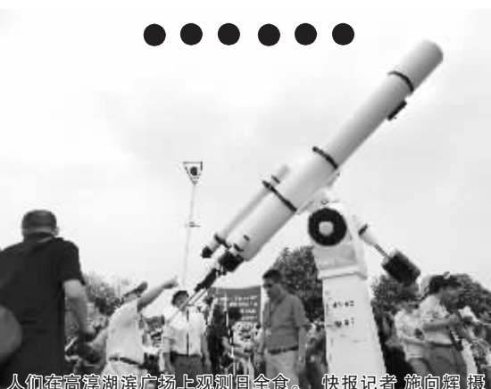
人们在高淳湖滨广场上观测日全食。

2035年9月2日发生的日全食值得期待,其日全食带经过西北、华北和北京市区。这是北京城400年来才有的机遇,与22日这次日全食一样,也是上午8点多钟,但日全食时间不到2分钟。