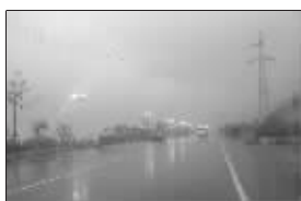
9:10 闾江口路灯亮起

昨日上午9:00左右,《生活无锡》驱车从梅园地区沿着十八湾公路,直往马山方向驶去。从9:10左右开始,整个天空的颜色开始明显变得昏暗起来,仅仅10多分钟,行驶在十八湾的机动车全部亮起了大灯。突来的黑暗,让不少驾驶员不是很适应,一些车辆逐渐放慢了行驶速度,虽然阴雨天看不到日全食的变化过程,但很多人也乐意观赏一下快速变化的天空,基本上机动车都在缓缓行驶。在十八湾远望马山的十里明珠堤,一排提早开启的路灯,在灰暗的天空下,显得格外亮眼。至9:20左右,天空已经几乎看不见一丝亮光,犹如黑夜来临一般。原本从傍晚至黑夜的1小时左右的变天时间,竟浓缩成了短短的10多分钟。在闾江口环顾四周,除了路灯的光亮之外,其他所有地方变成了漆黑一片。不少驾驶员都把车停靠在路边,冒雨下车观赏这难得一见的奇景。