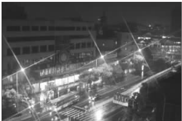
日全食出现时,无锡呈现出夜间的绚烂