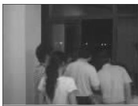
市民聚在窗口看日全食

昨天上午9:33,雨持续下个不停,锡城的天空开始出现异常,天空开始慢慢变暗,在中山路上,有人大呼“日全食要来了”,引得不少市民都好奇地张望天空,路旁小店的店主也都站到店外准备一睹“日全食”的风采,9:35锡城的天空已经变得和平日晚上九点一样黑,中山路上的路灯也在瞬间全部亮了起来,路上小轿车的大灯和公交车的大灯交相辉映,白天瞬间变成黑夜,让人有时间倒流的感觉。“黑夜”持续了5分钟左右,一直到上午9:40,锡城的天空才开始慢慢变亮,到上午9:43,锡城的天空已经恢复了正常。