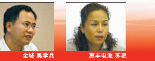
服务联盟成员签下承诺

经过热切的讨论和交流,与会的嘉宾一致认为:从自身做起,共享售后服务资源。在南京消费者协会和南京电动车行业协会的指导下,一个由现代快报倡议、品牌厂商和经销商、电池生产厂家共同参与的公益组织——南京电动车服务联盟正式成立。