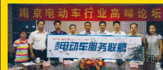
南京电动车行业高峰论坛引起业界关注

本周三,由现代快报发起,南京市消费者协会、南京市电动车行业协会联手举办的“南京电动车行业高峰论坛”隆重召开。对“孤儿电动车”的共同关注,让南京电动车行业的近20位精英齐聚快报,献计献策。