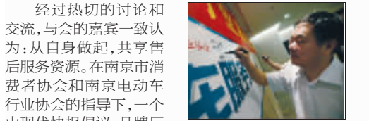
服务联盟成员签下承诺

经过热切的讨论和交流,与会的嘉宾一致认为:从自身做起,共享售后服务资源。在南京消费者协会和南京电动车行业协会的指导下,一个由现代快报倡议、品牌厂商和经销商、电池生产厂家共同参与的公益组织——南京电动车服务联盟正式成立。