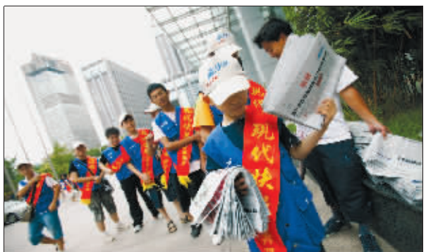
未来一个月,他们的身影将活跃在南京街头

此时阳光明媚,我的心情格外舒畅,这将会是我一个难忘的暑假,一次难忘的历练。也希望那些失学的孩子们能早日背起书包,走进校园!