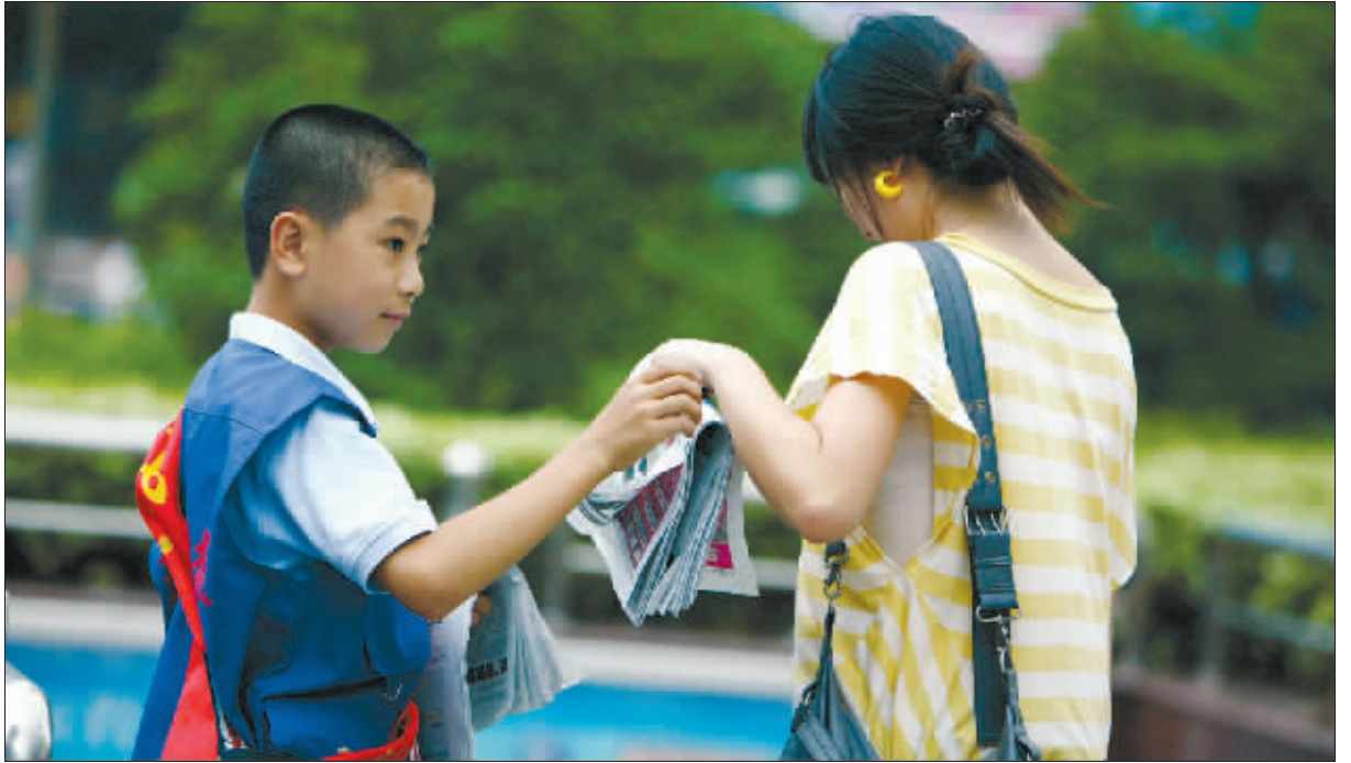
小小报童义卖报纸,既锻炼了自己,也帮助了他人