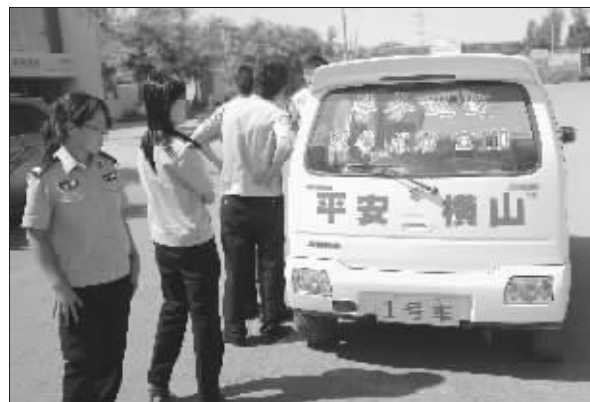
这辆车的车牌位置悬挂着“1号车”的牌子

嫌疑人朱某现年46岁,涪陵人,此系其替其堂兄讨债。据了解,朱的堂兄与公司有经济纠纷,经法院审判,朱的堂兄败诉。为平息朱某情绪,在近3个小时现场处置工作中,民警反复劝说朱某,对其进行法制教育。但朱某情绪激动,扬言要立即引爆炸药。中午12时许,朱某继续劫持人质李某离开现场。在民警包围下,李某趁机安全脱逃。民警立即鸣枪示警,令朱某放下炸药和凶器。但朱某不听警告,反而手持尖刀和“炸药”扑向民警。危急中,现场民警依法果断开枪,将其击伤。后朱某送区医院抢救无效死亡。随后,民警在朱某携带的包裹物上发现了爆炸引线。包裹内物品已送有关部门检验。案件处置过程中,长寿区检察院提前介入、参与处置,并认定现场民警处置程序及使用武器合法。 据《重庆晨报》