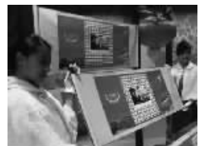
新中国首款《开国大典》丝绢邮票

了‘天子之笔’的灵气,希望能托毛主席的福,庇佑孩子人生道路笔直顺畅,激励孩子像毛主席一样,年少时就志存高远,国笔送给正在读书的孩子再合适不过了。”