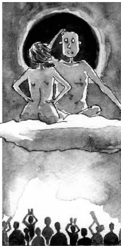
绘图/鲁嘉 插画师 美国SND插图奖获得者 已婚

五百年一遇的日全食出现了,月亮和太阳的爱情在500年一遇的天文奇观中走到了一起。我们观望了日全食,也观望了我们的爱情。