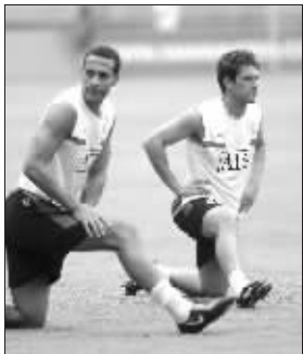
▲欧文（右）最受球迷喜爱 ▼拍不到巨星就拍海报吧