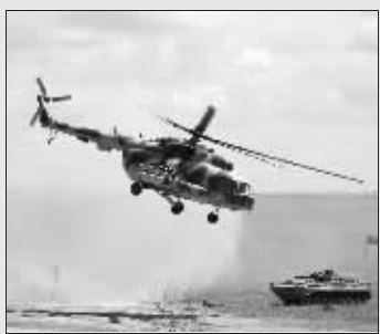
俄方直升机发起攻击