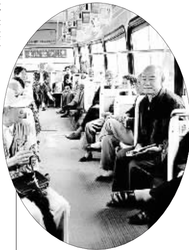
老人乘车将享更多优待 资料图片