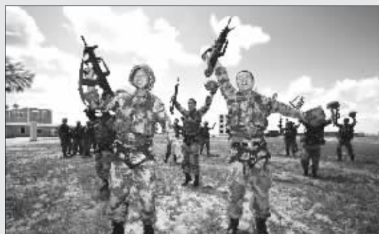
中方参演特种兵欢呼胜利