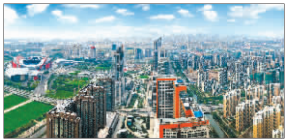
河西商业的明天让人期待

游城开门营业,让曾经只拥有一条商业街的夫子庙地区,有了属于自己的大型购物中心,并以一种颠覆性的理念让700万南京人耳目一新。至此,夫子庙不再被称为外来人口的集散地,开始显露它的商业活力。