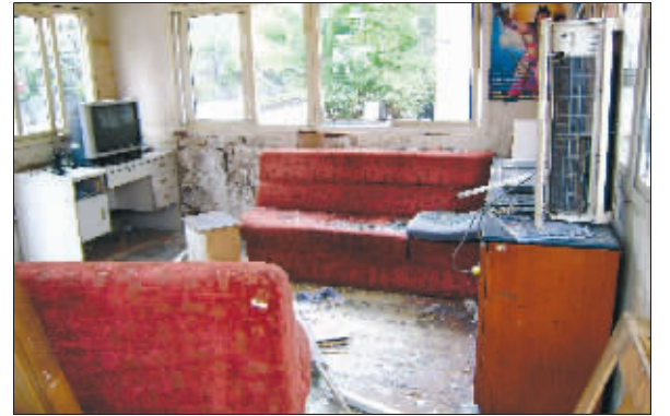
保安室内满地玻璃碎片,多件家具被毁

昨天上午10点多,鼓楼区草场门大街阳光广场发生一起血案,几十个男子围住商务楼一阵打砸,还有人在群殴中受伤流血。血腥场面吓得路人纷纷绕行,随后大批警察到场,控制住局势。市民纷纷表示,这起暴力事件让人忧心。“太没安全感了!光天化日之下竟然还能让几十个人又打又砸,还伤了人!”