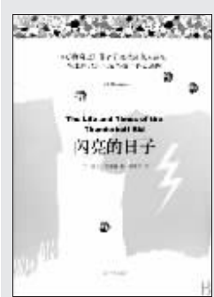
(美)比尔·布莱森 著 陈新宇 译 上海译文出版社 2009年5月版

裹在襁褓里的人做什么都是探险,因为世界不在自己的掌控之下,格林童话里老写到大拇指、巨人国之类的事,智勇双全的正常人一再对巨人实施成功的戏耍与偷袭,满足孩子挑战成人世界的快意。在动画片里我们常常看见树屋,那里面空空如也,它的建造者们甚至不懂什么叫回归自然,只是想离开地面,也离开成人的视线,去做一些集体性的、秘密的事情。