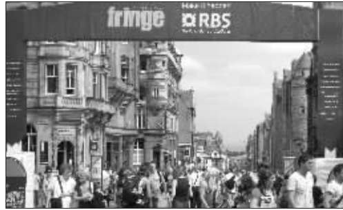
地点:爱丁堡 时间:2008年夏天

在世界各国的名城,尤其是那些旅游城市,都有一条热闹非凡的特色大街,比如巴黎的香榭丽舍、纽约的百老汇。对爱丁堡来说,非皇家哩大道莫属。