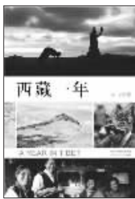
作者:书云 出版社:北京十月文艺出版社

小说名来自《墨子·所染》:“素丝入染房,染于苍则苍,染于黄则黄。”人在官场便如素丝入染房,很多对现实的抵抗无奈而艰难。“苍黄”的色调,与小说调子相符。