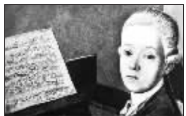
莫扎特儿时作品被发现并首次演奏

法新社报道,莫扎特作品“出土”并非孤例。去年5月、9月及2006年均有疑似莫扎特作品出现,其中去年9月在法国南特发现的乐曲后经证实为莫扎特所作。