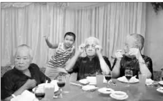
三人书写了一个传奇