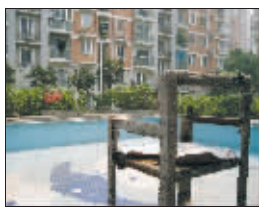
世纪明珠苑小区泳池旁的椅子锈迹斑斑