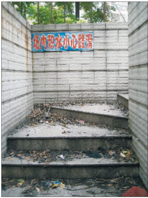
通往世纪明珠苑小区泳池的道路上垃圾满地

关于泳池的现状,勤德家园物管保安队长表示,“从2005年小区交付以来,这个社区的游泳馆一次都没有用过,小区游泳池的运行成本太高,我们没有考虑过投入使用。此外,游泳池一旦开放,噪音问题会影响到附近居民的