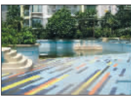
金色新城小区泳池已闲置