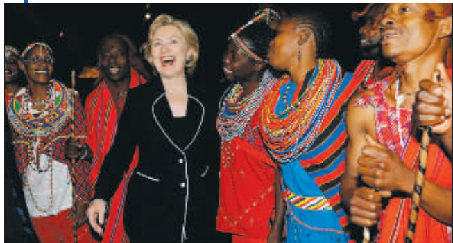
8月5日,肯尼亚首都内罗毕,希拉里与舞蹈演员一起跳肯尼亚传统的马赛舞