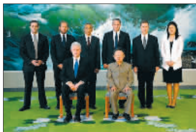
克林顿与金正日合影