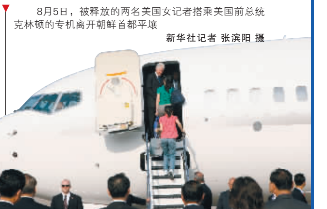
8月5日,被释放的两名美国女记者搭乘美国前总统克林顿的专机离开朝鲜首都平壤