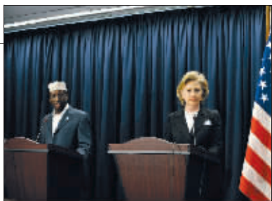
8月6日,希拉里(右)在美国驻肯尼亚大使馆内与索马里总统艾哈迈德共同出席新闻发布会