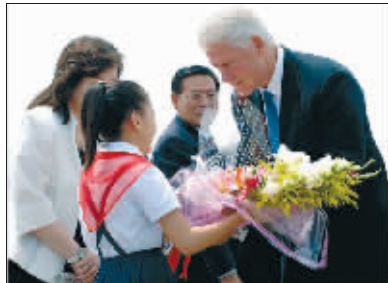
朝鲜小学生给克林顿献花