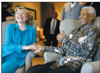
希拉里与南非前总统曼德拉会面

克林顿夫妇的这一出“二人转”反映了美国在金融危机冲击下综合国力下降时的矛盾心态:一方面,丢不掉世界头号强国的文化优越感,一有机会就要向别人宣扬自己的“先进”价值观;另一方面,遇到具体问题时可变成一个彻头彻尾的“实用主义者”,只要达到目的,一切都好商量。这,也许就是希拉里国务卿“巧实力”外交政策的真谛吧。 快文