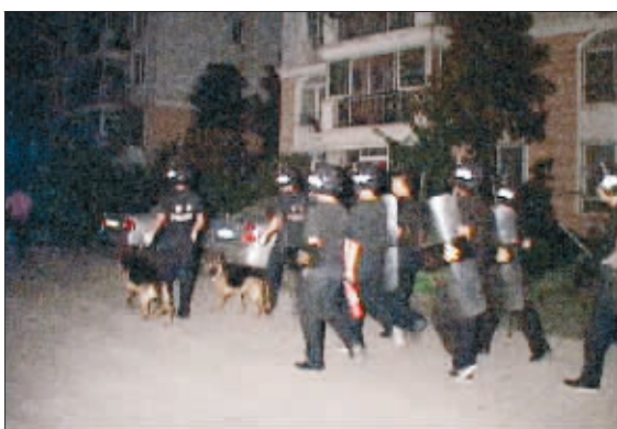
警察手持盾牌,带着警犬,在小区内寻找藏獒