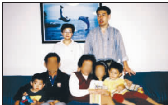
曾经无比幸福的一家人

将凶手抓捕并绳之以法,才能告慰死者的亡灵,让活着的人更有信心。我们了解到,新州警方对此案高度重视,投入大量警力全力调查。在此,我对