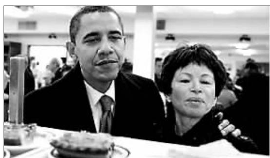
2008年11月,奥巴马与贾勒特在芝加哥的餐厅一起用餐,关系亲密

法国人对政治人物的私生活不太感兴趣,所以直到两年前,法国前总统希拉克快退休时,人们才发现,他的