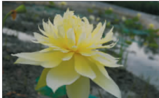
惹人怜爱的“秣陵秋色”