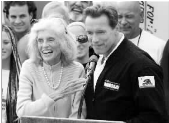
2003 年 10 月 6 日,尤尼斯·肯尼迪·施莱佛 (左) 和她的女婿阿诺德·施瓦辛格在一起

“智障姐姐”的秘密。肯尼迪兄妹中的老三罗斯玛丽是智障人士。1963 年,施莱佛组织一次夏令营活动,为智障儿童提供参与体育活动的机会。