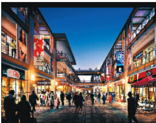
临街金铺正在热销

日前，笔者从南京万达广场销售中心了解到，该万达金街内街商铺公开数月即售罄，今年累计已销售10亿元。目前正在热销的是紧邻水西门大街的20席临街金铺。