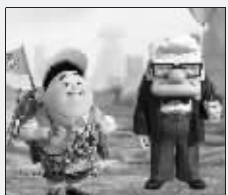
《飞屋环游记》是今年3D影片的代表作

最近的《冰川时代3》《飞屋环游记》票房走势更猛。记者从南京新街口国际影城了解到,