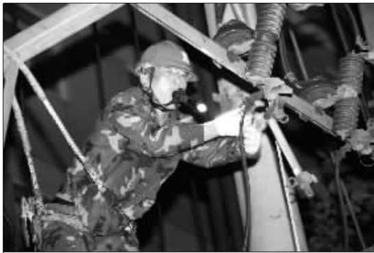
昨日 19:34,因雷击造成 10 千伏百子亭线路设备损坏,南京供电部门紧急启动应急预案,公司领导靠前指挥,紧急组织现场勘察,两小时就完成抢修,得到周围居民的称赞。