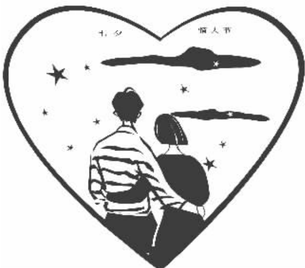
绘图/鲁嘉 插画师 美国 SMD 插图奖获得者 己婚