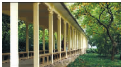
玄武湖樱洲爱情长廊

莫拉克悄悄地走了,带走了阵阵清凉,秋老虎汹汹地来了,带来了骄阳燥热,更带来了热情的会员。本周新增会员1005人,其中快报首届交友节现场报名达500余人。随着会员人数的迅猛增长,许多会员迫切地希望有更多与异性接触了解的机会,如有的男会员一次要求与29位女会员见面,以往“现代红娘”采用的单纯一对一介绍方式显然不能满足这样的要求,为了更好地服务大家,提高效率,8月26日,即中国传统情人节——七夕之夜,“现代红娘”在玄武湖公园举办“快报玄武湖交友节之七夕大