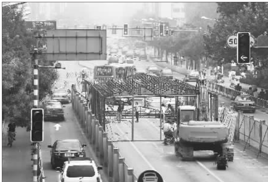
洪武路部分路段围挡,车辆通行受到限制