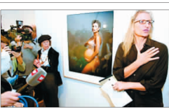
她拍摄的黛米·摩尔的怀孕照作为《名利场》杂志的封面,曾引起不小争议,甚至有不少地方让这期杂志下架。

曾获“当代传奇”奖 从拍摄尼克松辞职,到拍摄奥巴马竞选;从随同滚石乐队巡演,到进入《名利场》开始人物肖像拍摄生涯;列依和小野洋子、黛米·摩尔、乔丹、贝克汉姆、施瓦辛格……都曾一度成为她镜头中的主角。毫无疑问,莱博维茨是这个时代最著名的摄影师之一。2006年,美国杂志协会在评选40年来最优秀的杂志封面照时,头两名都属于她——《滚石》的约翰·列侬封面和《名利场》的黛米·摩尔封面;她也曾