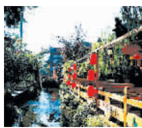
推荐地:丽江 享受甜蜜的宁静

七夕这天,和心爱的她(他)一起出发,寻找完美爱情。不在乎路途有多远,只为能与你共同吹响出行的号角,在不同的地方演绎只有你我的故事。