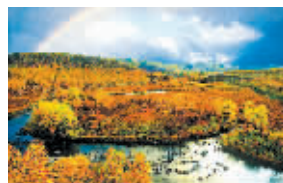
推荐地:阿尔山 专为你唱情歌

被大自然宠坏了的三亚集中了海南岛最美的风光:这里有最宜人的气候、最清新的空气、最和煦的阳光、最湛蓝的海水、最柔和的沙滩、最美味的海鲜……和海在一起,连空气都是浪漫的,所以在这里你可以不费任何心思随时讨好爱人的心。清晨、黄昏和他(她)十指紧扣在白沙上散步;跳入海中一同戏水或尝试一下浮潜,在海平面下亲密接触;去天涯海角,摆个最甜蜜的Pose合影,留着以后慢慢看,慢慢怀念。