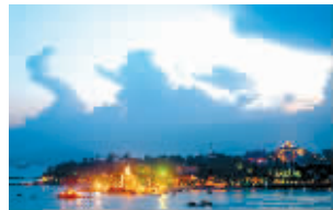
推荐地:厦门 转角遇到爱

有许多朋友说,厦门是个有爱情魔力的城市,鼓浪屿的浪漫小巷、厦门大学的花开花落、南普陀寺的晨钟暮鼓。它的魅力不张扬、不做作,含蓄地藏在内心——对于寻找爱情的人们来说,这就是个最容易滋生情愫的地方。