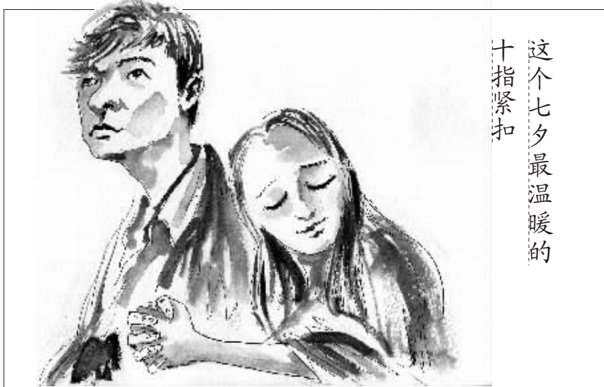
绘图/鲁嘉 插画师 美国 SND 插图奖获得者 已婚