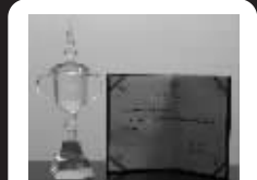
荣获2009年度“扬子晚报”3.15 消费者满意的出国留学机构荣誉称号