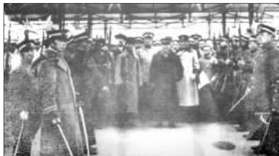
孙中山赴南京就任时在上海车站与欢送者的合影

袁希洛何许人也?同盟会成员,国民党元老。1912年1月1日晚上,在中华民国临时大总统的就职典礼上,正是作为江苏省代表的他,代表各省将“中华民国临时大总统印”授予孙中山。他的回忆,真实可信度显然很高。