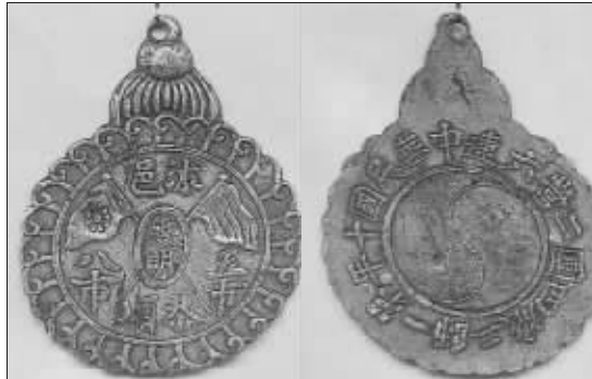
张永魁收藏的孙中山佩戴过的银质胸章正反面