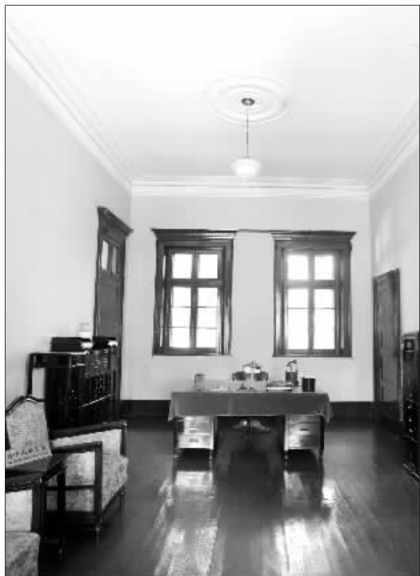
总统府景点内的孙中山办公室

长 江路292号,中国近代史遗址博物馆,因在民国时期曾是国民政府总统府原址,至今还被人们称为“总统府”。总统府内西花厅,这是一座带着浓郁的法兰西风格的西式洋房,坐北朝南,七开间,中间是设计精巧的亭形拱式门斗,两旁高大的圆拱连成长长的走廊。孙中山就任临时大总统的90天里,就在这里办公。后面一幢小楼,现在是陈列室,展示着与孙中山有关的文献资料以及实物。二楼的玻璃展橱里,静静躺着一方大印,上面刻着“中华民国临时大总统印”。然而细细辨认,旁边粗糙的木纹暴露出它的真实身份:这只不过是个仿制品。临时大总统印的原件自然会被妥善保管,当然不会放到陈列室中;不过,这个看似合情合理的依据,放在这里却不合适。因为,就连研究孙中山的专家也搞不清楚,那枚大印究竟归于何处。