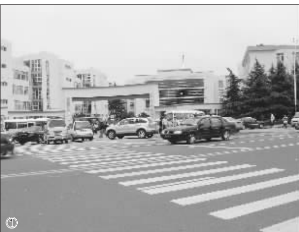
①晋陵路上某中学门口送孩子上学的私家车随处可见 ②几个学生喜滋滋地抱着书本去班级分发 ③拥堵时段,晋陵路上私家车开上了公交车专用车道

全市中小学迎来新一学期的报到日,送孩子上学的大军如期而至。昨天,市区范围内的不少中小学门前出现了交通拥堵状况,这其中,家长私家车送学是造成校门口交通拥堵的主因。