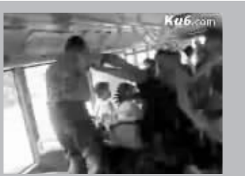
本文配图为视频截图

powerdongzi:老同志的武功好生了得!居然只用区区一只手就将年轻力壮的后生打得毫无还手之力,不由得令人好生景仰!