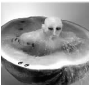
围观怎么不通知我?