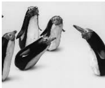
童鞋们,我们也去吧~