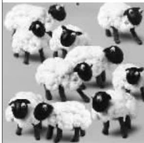
听说今天要出大事,我们去围观?

http://www.tianya.cn/techforum/content/396/15244.shtml