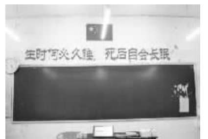
“这是我班在今年高考前两个月挂出的横幅……很雷人!”