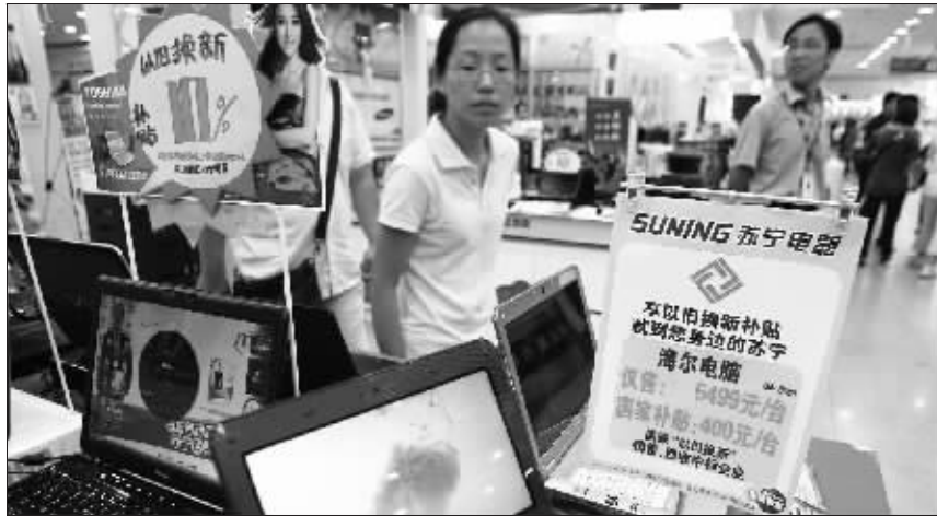
江苏家电“以旧换新”活动现场

昨天上午,欧先生在苏宁电器商茂店看中一台原价1299元的海尔冰箱,最终以909.1元“拿下”,便宜了389.9元!从9月1日起,随着江苏家电“以旧换新”的正式启动,凡是购买电视机、电冰箱(含冰柜)、洗衣机、空调和电脑的消费者,只要交售废旧家电,都享受到财政发给的这一“大礼包”,补贴活动将延续到2010年5月31日。